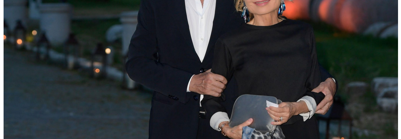
[Lilli Gruber conduce da Monaco di Baviera il settimanale "Focus TV" su "Pro 7", televisione del gruppo Kirch]

Nel 1990 viene chiamata da Bruno Vespa al Tg1, dove per due anni segue gli eventi più importanti di politica estera: dalla guerra del Golfo al crollo dell'Unione Sovietica, dal conflitto israelo-palestinese alla Conferenza di pace per il Medio Oriente, alla vittoria di Bill Clinton alle presidenziali americane del 1992. Lilli Gruber lavora anche all'estero: nel 1988, per la tv pubblica tedesca "SWF", conduce un talk-show mensile sull'Europa; nel 1996 lancia, conduce e co-produrre da Monaco di Baviera il settimanale "Focus TV" su "Pro 7", televisione del gruppo Kirch.