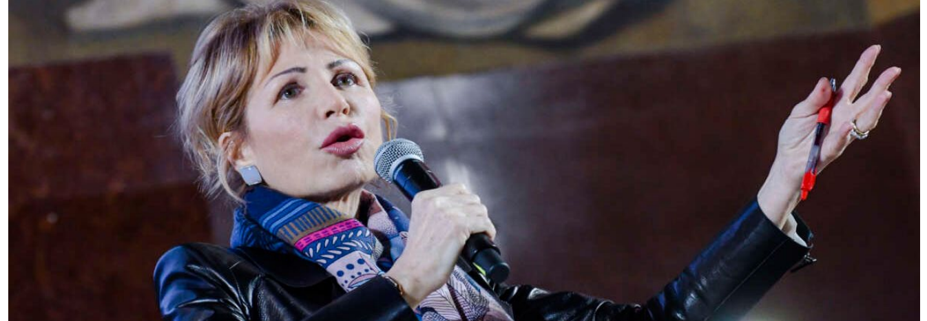
[Lilli Gruber all'inaugurazione di "Obiettivo 5, il campus di formazione per la parità di genere" a Roma]

Negli anni fra il 2009 e il 2024 continua la conduzione di "Otto e Mezzo" su "LA7" e pubblica diversi libri: un tema ricorrente delle sue opere sono i diritti delle donne. Ne è un esempio il libro del 2019, intitolato "Basta! Il potere delle donne contro la politica del testosterone". Nel 2021 pubblica un nuovo libro, sulla vita di una celebre giornalista inviata di guerra, terza moglie di Ernest Hemingway: "La guerra dentro. Martha Gellhorn e il dovere della verità". È uscito, edito dalla "Rizzoli", lo scorso 16 aprile il suo nuovo saggio con un titolo paradigmatico "Non farti fottere. Come il supermercato del porno ti ruba fantasia, desiderio e dati personali".