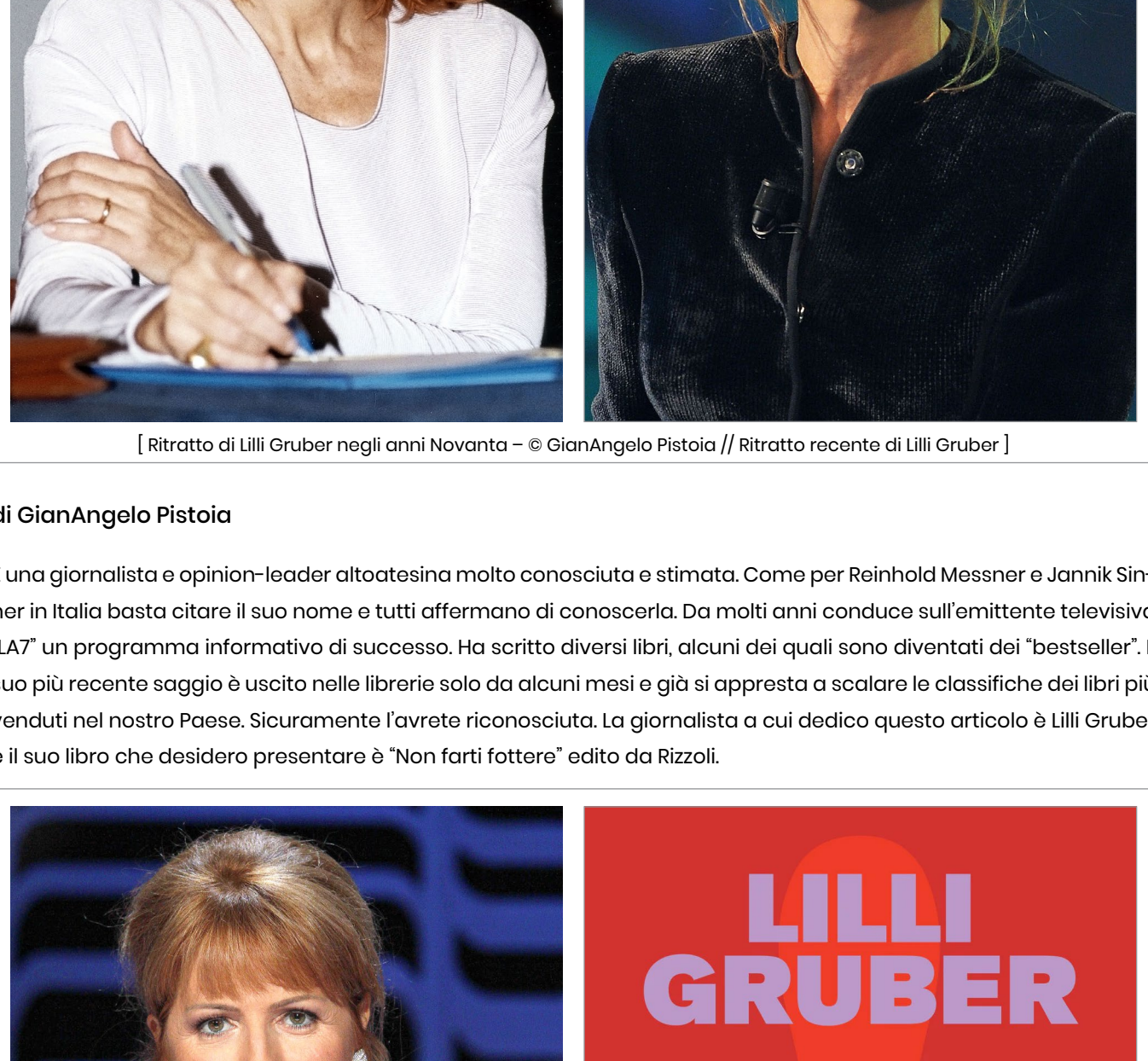
[Ritratto di Lilli Gruber negli anni Novanta - // Ritratto recente di Lilli Gruber]