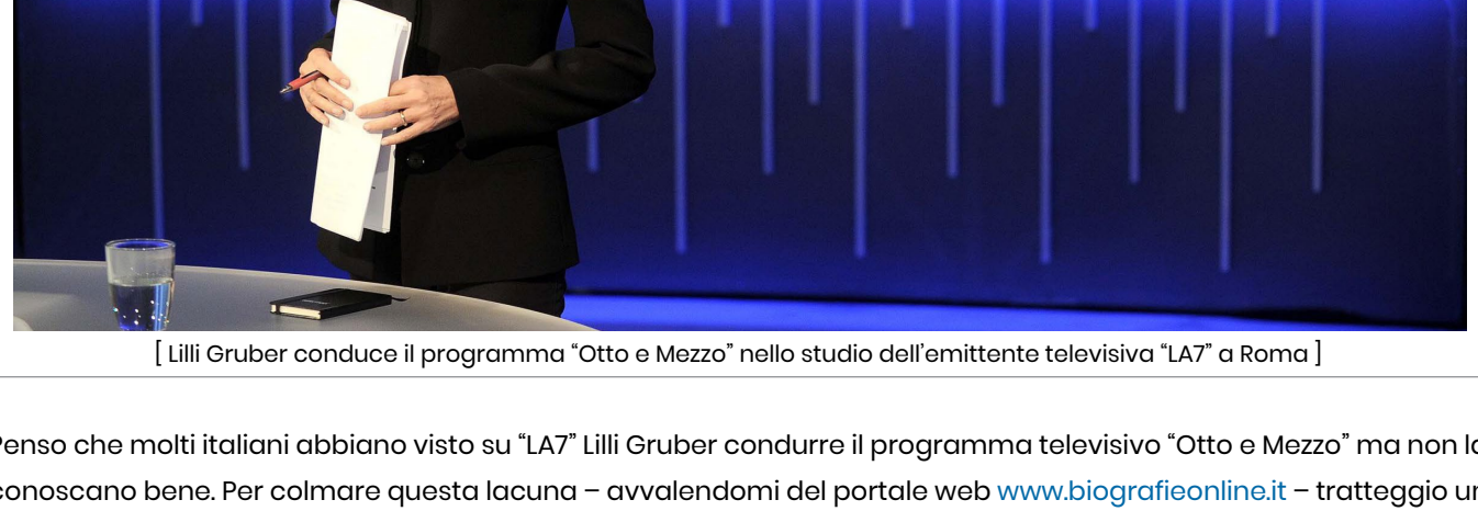
[Lilli Gruber conduce una programma di approfondimento informativo in uno studio televisivo a Roma]

Lilli Gruber, con l'ausilio dell'Ufficio Stampa della Rizzoli, ha già iniziato a promuovere il saggio "Non farti fottere" nelle principali città italiane e intende presentarlo in estate anche nelle località turistiche balneari e montane del "Bel Paese". Sicuramente riserverà alcune tappe di questo suo tour promozionale anche alla sua regione d'origine, il Trentino-Alto Adige/Südtirol.