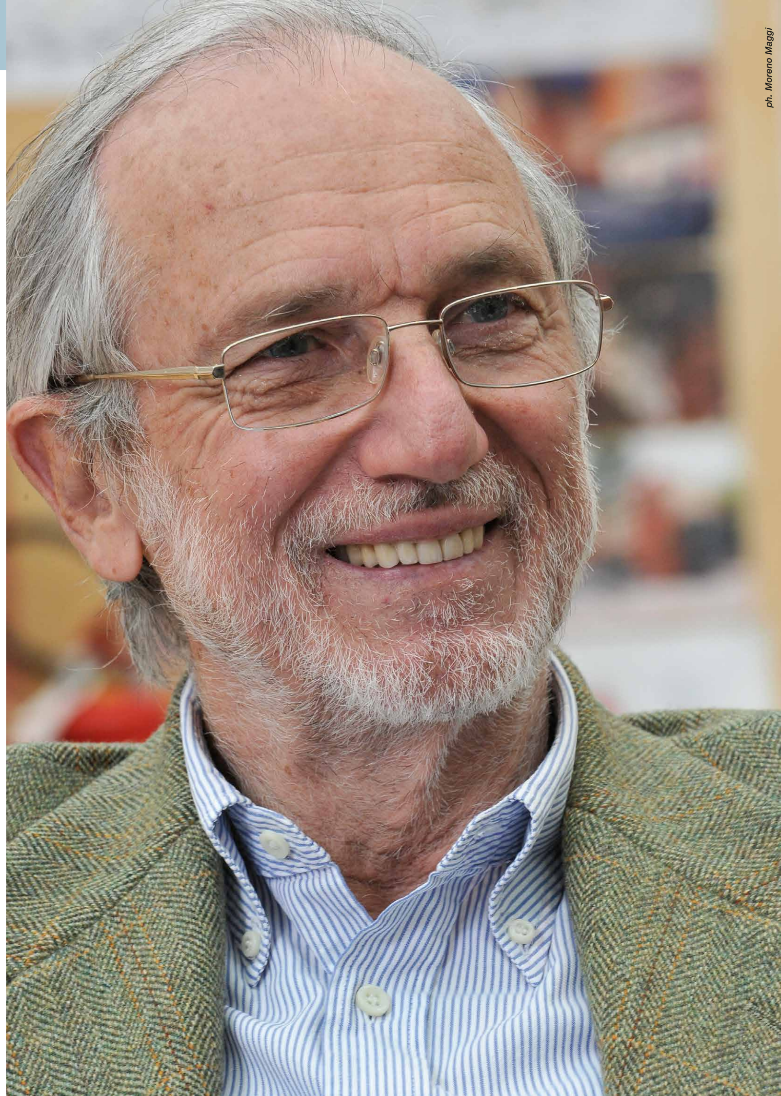
ph. Moreno Maggi